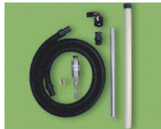
모델 6195 및 6196-30 양방향 드럼백에 포함되는 액세서리에는 진공호스와 알루미늄밴드가 있다.