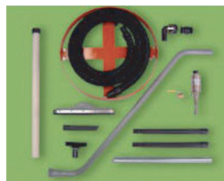
모델 6296 고급형 드럼백에는 드럼받침대, 회수용키트, 진공 호스 및 각종공구가 포함된다.