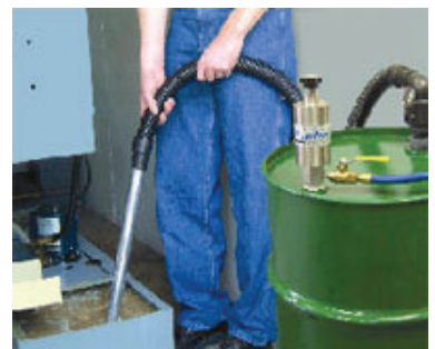
모델 6196-30(30 갤론 양방향 드럼백)으로 CNC 옆의 통에 있는 냉각수를 쉽고 빠르게 빨아들일 수 있다